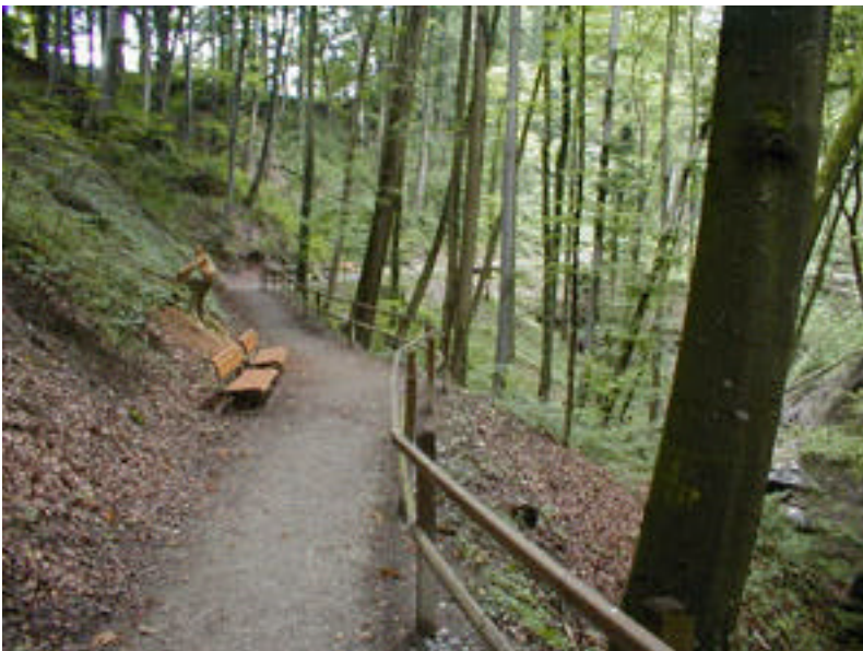
Abbildung 4. Anschliessend an das Gelände des Alterszentrums Platten beginnt hier der Wasserfelsweg. Er wurde im Jahre 2001 gebaut. Er ist alters- und behindertengerecht.