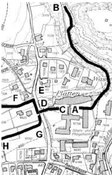
Abbildung 2. Skizze für einen horizontal verlaufenden Durstweg