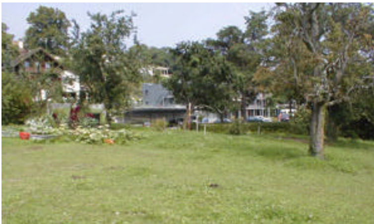
Abbildung 9. Standort unterhalb des gemeindeeigenen Wohnhauses an der Plattenstrasse. In Richtung Bildmitte führt der im Rekurs beantragte horizontale Durstweg.